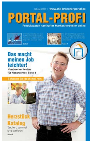
Bildunterschrift: Wissenswertes kompakt: Der „Portal-Profi“